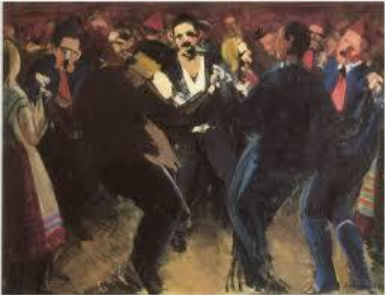
Færøsk dans – målning av Samuel Joensen-Mikines 1944