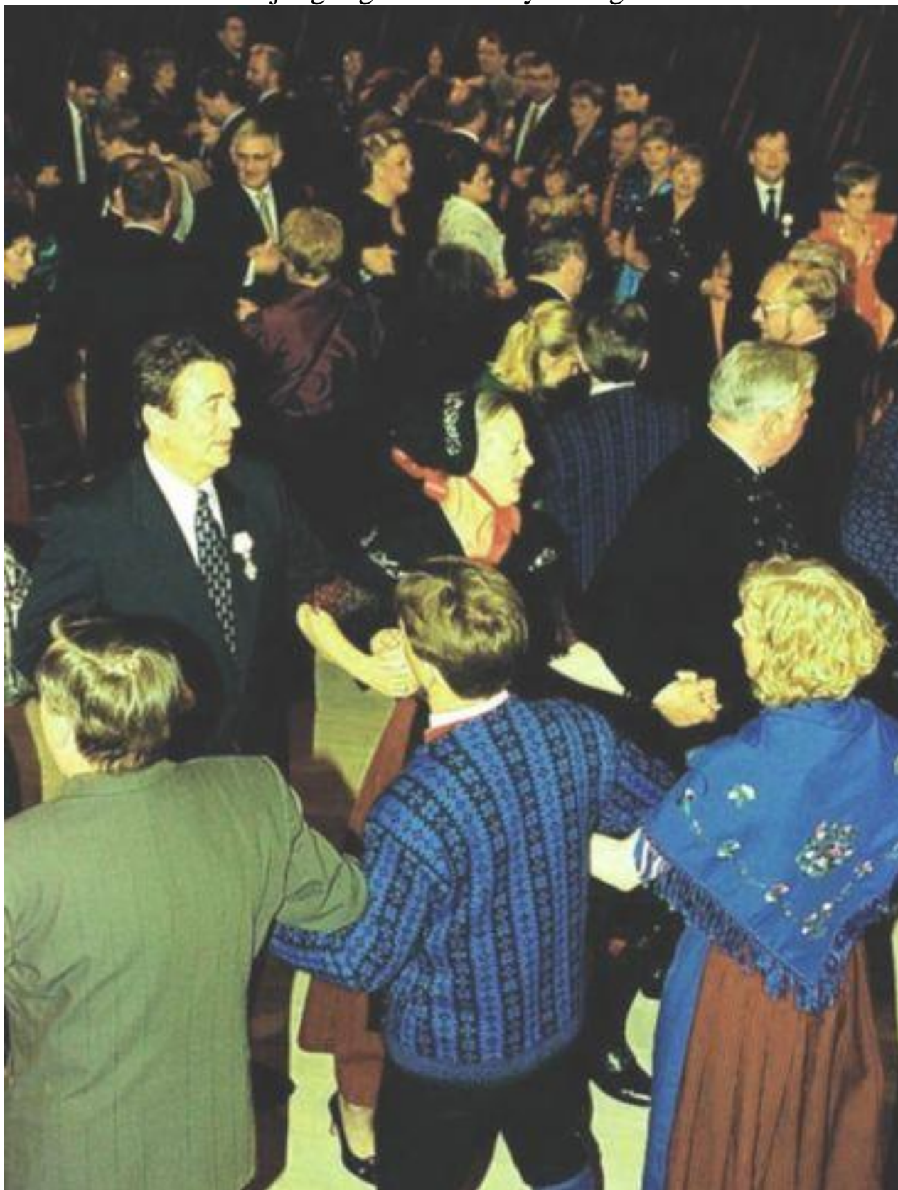
Färöisk dans. Danmarks drottning mitt i bilden.